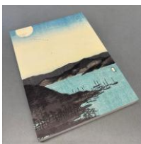
限定版▶ （裏表紙 ※帯を外した状態）