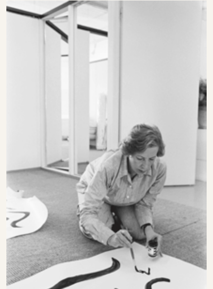
アルミ・ラティア(1912-1979)