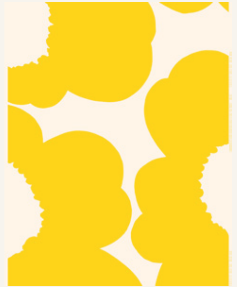
(イン ウニコ) マイヤ・イソラ 1964年/2023年 © Marimekko Oyj Suomi-Finland Maija Isola 1964/2023

会場ではアートユニット・plaplax協力のもと、ヘルシンキの「プリントファクトリー」を動的に演出。デザイナー・皆川 明 (ミナ ペルホネン) とマリメッコの協働によるインスタレーションも見どころのひとつです。マリメッコの世界を多角的な視点から紐解き、体感いただく機会となるでしょう。