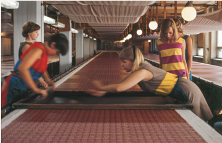
ヘルシンキにあるマリメッコのプリント工場(1965年) *ハンドスクリーンでファブリックをプリントする様子