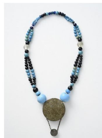
《首飾り》旭川市博物館蔵（河野コレクション）