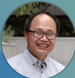
(公財) 京都高度技術研究所 地域産業活性化本部長

行政や官公庁に対する「起業家人材育成/発掘」をテーマにしたプログラムの提供やイベントの企画、大企業へ向けたイントレプレナー（社内起業家）機運醸成に関するトレーニング事業や、社内の人材育成プログラムの設計、など、多岐にわたる活動を行っている。京都女性起業家賞、近畿経済産業局LED関西受賞。