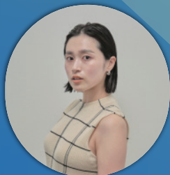
OoO株式会社 代表取締役