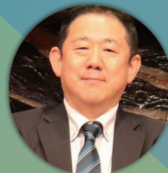
日本政策金融公庫 北近畿地区統轄

京都府出身。吉本興業所属、お笑い芸人サバンナのツッコミ担当。立命館中学校・高等学校を卒業後、立命館大学産業社会学部へ進学し卒業。「ブラジルの人間こえますか～」など1000個以上のギャグを持つ。2022年より勉強を始め、2024年にはファイナンシャルプランナー1級に合格。著書に「年収300万で心の大富豪」「FP1級取得！サバンナ八木流 お金のガチを教えます」「世界一ゆるい勉強法（2026年1月中旬発売予定）」。柔道二段、極真カラテ初段。