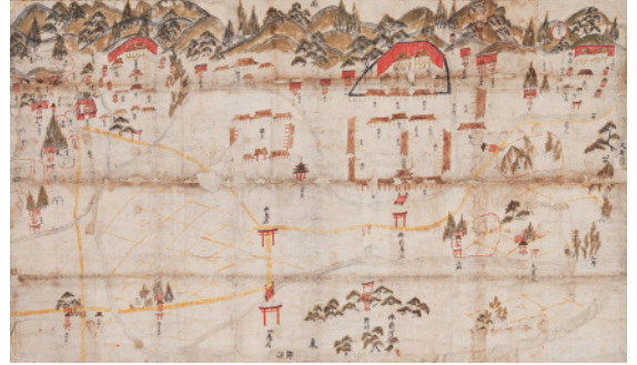
山城国松尾神社近郷絵図 室町時代 14世紀 松尾大社蔵