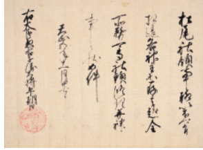
織田信長朱印状 天正5年(1577)11月27日付 松尾大社蔵

京都市・西京区に鎮座する松尾大社(まつのおたいしや) 初めての神宝展です。松尾大社は渡来氏族である秦氏が創建に関わった神社で、平安京遷都以後は都の守護神の一つとして崇められました。市内にも多くの氏子を持ち、酒・醸造の神として全国の酒造会社の崇敬もあつめています。わが国最古級の神像彫刻として国の重要文化財に指定されている御神像や、初公開となる源頼朝や織田信長ら中世の古文書をはじめ、祭礼や酒神としての歴史、酒造りについて史資料を集め展観します。