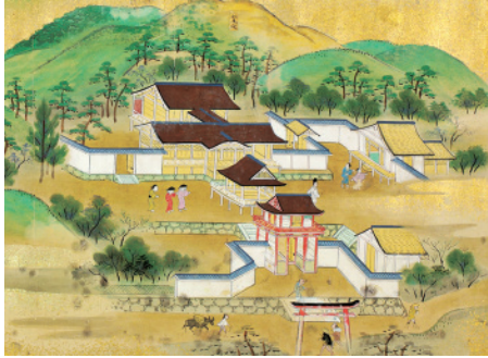
京名所絵巻(部分) 佛教学部附属図書館蔵