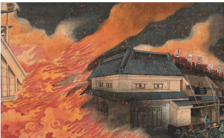
trkk05.jpg 小林清親 消火活動( I ) 「火災の図」シリーズの内