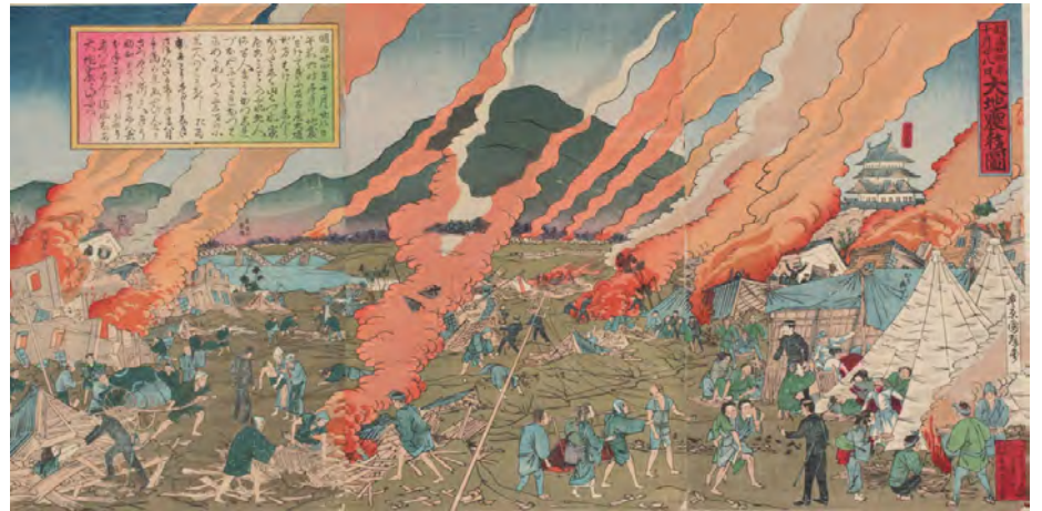
trkk04.jpg 豊原国輝 濃尾大地震後図 (1891年)