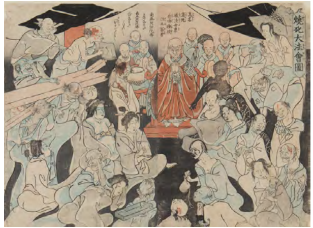
trkk02.jpg 歌川国芳 焼死大法會圖 (1855年)