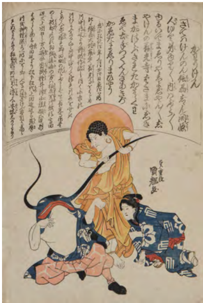
trkk03.jpg 歌川国輝 かわりけん (1847年)