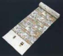
霞に春秋草文様着尺(復元) 2011年