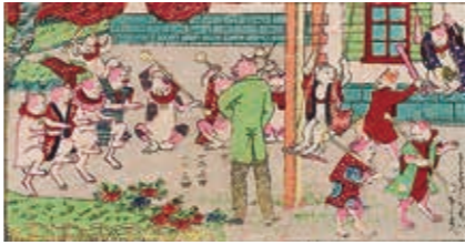
梅窓《新板猫の勉強学校》(部分) 個人蔵

「もしも、うちの猫が人のように話したら?」そんな想像をしたことはありませんか。天保12年(1841)頃から、浮世絵師の歌川国芳は猫を擬人化した絵や、歌舞伎役者を猫で描いた戯画(滑稽な絵)を次々と発表していきます。本展覧会では猫の擬人化作品と、それらを描いた国芳を主軸に据え、江戸時代の擬人化表現の面白さに着目していきます。