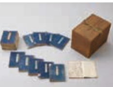
重要文化財「源氏物語」大島本 古代学協会蔵

紫式部の生きた時代の様相を資料によって紹介するとともに、重要文化財の『源氏物語』(大島本)を中心に、物語から紡ぎ出された美術品を展示して、その世界観をご堪能ください。