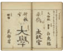
『好古日録』古瓦文字(部分) 江戸時代

近世考古学の第一人者とも評される藤貞幹。考古学史研究に定評のある京都木曜クラブと共に、貞幹の事績を丁寧に読み解きます。