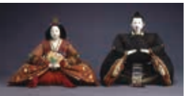
雛人形(古今雛) 江戸時代後期