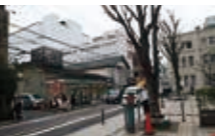
現代の阪東屋町の風景

江戸時代の京都の基礎単位である町には、町の運営の記録群ともいえる「町有文書」が蓄積されました。近年の調査で阪東屋町(東洞院錦南下ル両側町)に関する町有文書が新たに確認されました。本展ではこの文書群を通して江戸時代の町の実態について考えます。