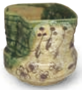
織田向付 京三条せと物や町(中之町)出土 桃山時代 京都市蔵

おおらかで伸びやかな風合いをもつ桃山陶器。京都市立芸術大学とのコラボ企画で、その多様な魅力をお楽しみください。