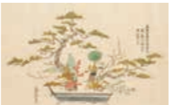
大住院以信「立花砂物図」 延宝6年(1678) 京都府立京都学・歴史館蔵

和の心を継承するいけばな。仏教の伝来とともに仏花から始まり江戸初期には立花の様式が確立されます。旧宮本溪雄コレクションを中心に、いけばなの歴史に触れます。