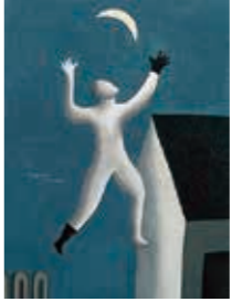
© Sompo Museum of Art, 2024 東郷青児《超現実派の散歩》1929年 油彩・キャンバス SOMPO美術館蔵

20世紀最大の芸術運動「シュルレアリスム」。フランスに始まり各地の芸術、思想、文化に影響を及ぼした運動は、日本の芸術家たちをも魅了します。『シュルレアリスム宣言』の発表から100年を記念する本展では、主にシュルレアリスムの影響を受けた日本の絵画作品を通して、多様なイメージの展開をご紹介しますと同時に、彼らが生きた時代を振り返ります。