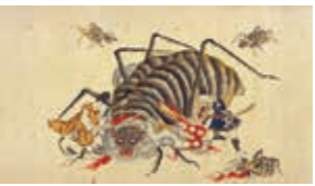
『土蜘蛛之草紙』(部分) 京都府立京都学・歴史館蔵

古来人びとは災害や疫病など人智を超えた現象を異界の住人の仕業と考えてきました。目には見えない世界を想像たくましく描き、そしてさまざまな魔よけやまじないの作法を編み出して戦ってきたのです。この展覧会では、人びとが恐ろしい異界からの接近に対処してきた様相を、京都府の所蔵資料によって紹介します。