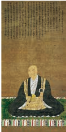
古淵慈梧賛・狩野山楽筆 「織田有楽斎像」 正伝永源院蔵

織田信長の弟、長益は織田、豊臣、徳川の3天下人に仕えて時流を乗り切った武人でした。「逃げた男」と揶揄されながら、余生は茶人「有楽斎」として京に隠棲し、正伝院を再興した文化人でもあります。有楽斎の400年遠忌にあたり、現在も墓を守っている建仁寺塔頭・正伝永源院に伝わる文化財を再度調査しました。ここで得られた知見をもとに、織田有楽斎という人物を今一度捉え直す展覧会です。