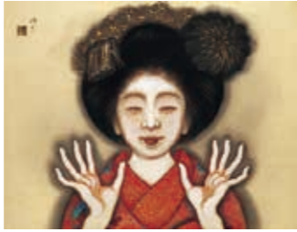
岡本神章《春の舞妓》1922年頃

明治、大正、昭和……。時代のうねりの中で、いつしか忘れられてしまった実力ある画家たち。本展では、彼らが遺した素晴らしい作品を見つけ出し、紹介してきた星野画廊のコレクションから、「少女たち」をテーマに紹介します。女性たちの人生のさまざまなが描かれた日本画と洋画、約120点を展示しますので、作品の放つ魅力を存分にお楽しみください。